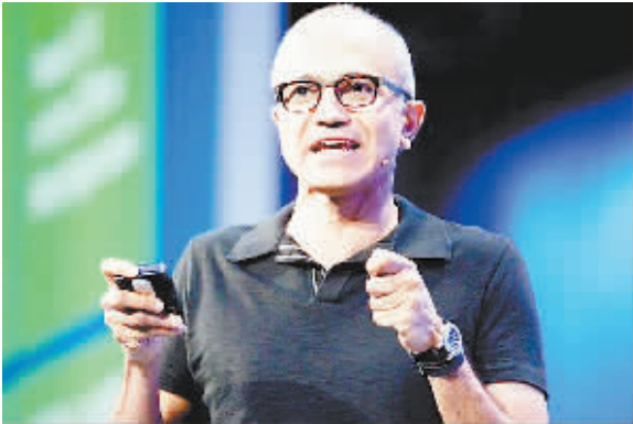
提升Windows Phone市场份额是微软新CEO纳德拉的重要任务

旧信誓旦旦。据悉,即将发布的Windows Phone 8.1将支持低端手机,同时也将更好地支持非触控设备。来自芯片供应商的信息也显示,下一版Windows Phone将支持高通骁龙200和400芯片组以及双SIM卡,因此适用于中低端设备。