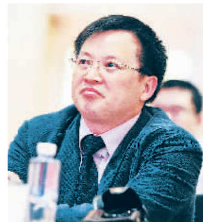
场投资者保护工作的统筹规划、组织指导、监督检查和考核评估,具体包括拟订证券期货投资者保护政策法规、负责

一位接近证监会的内部人士称,李量所在的投保局是证监会的内设机构,属于证监会的内部职能部门,投保局内设四个处室,分别是综合制度处、教育服务处、权益保护处和监督查处处,成立于2011年底,其主要负责证券期货市