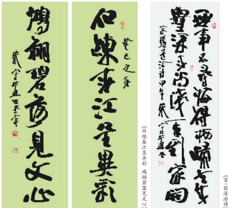
《白练春江呈异彩 鸿翔碧落见文心》

现为中国书法家协会第四届、五届、六届理事，中央文史馆书画院研究员，第九届全国文代会代表，中国书协国际交流委员会委员，北京世纪名人国际书画院副院长，《名人名家书画报》总编辑。中央电视台、北京电视台、《人民日报》、《光明日报》、《中华英才》、人民网等主流媒体和专业报刊介绍其书法艺术。