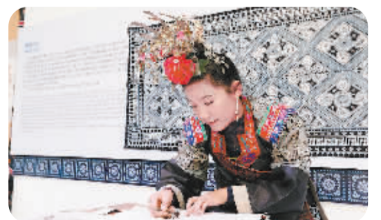
国家级非物质文化遗产项目蜡染技艺传承人现场展示