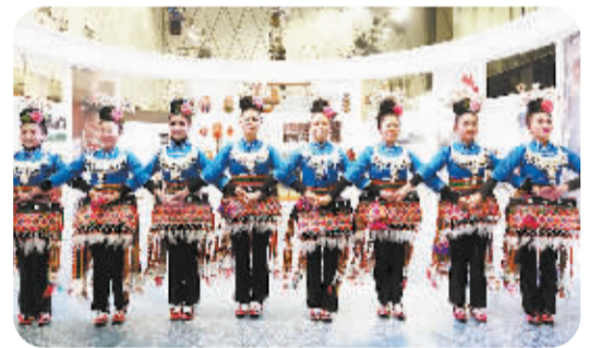
国家级非物质文化遗产项目苗族芦笙舞(锦鸡舞)现场展演

植根中国、融入当地是BMW对中国社会的长期承诺之一。作为BMW中国企业公民战略的重要组成部分,“BMW中国文化之旅”每一年的峥嵘历程,均向世人展现了其不断深入了解中国文化、融入中国社会的决心与努力。通过持续开展该项目,BMW不仅唤起了更多人对传统文化的认同以及对文化遗产保护的自觉意识,也构筑了一个开放的文化保护平台,吸引更多的年轻人主动关注中国传统文化,并积极探寻传统文化的内在价值,使之能够历久弥新,永绽光彩,而这也生动诠释了BMW所倡导的文明传承之悦。