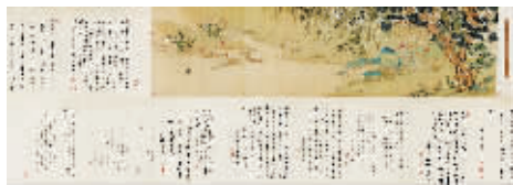
周道、上睿《李煦行乐图》