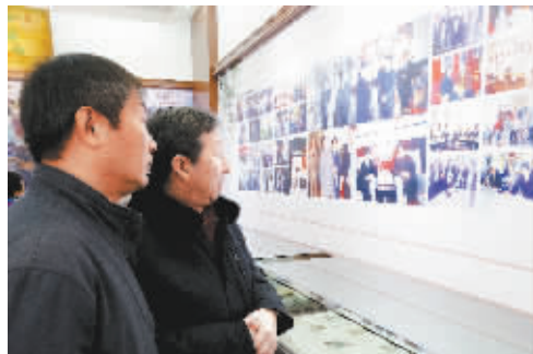
燕京书画社发展史展吸引观众驻足