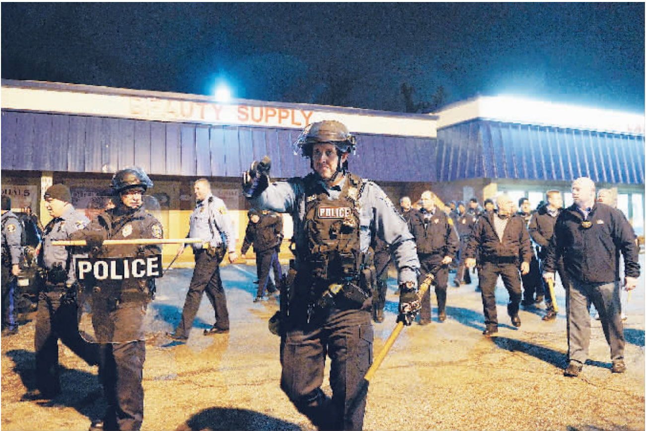
24日,在美国密苏里州伯克利,警察试图驱散示威者。密苏里州警方当日说,一名非洲裔青年23日深夜在圣路易斯县郊区一处加油站用枪指向警方,遭警方枪击,伤重不治身亡。这起枪击案发生在圣路易斯县伯克利郊区,距今8月弗格森枪击案事发地仅约3公里。