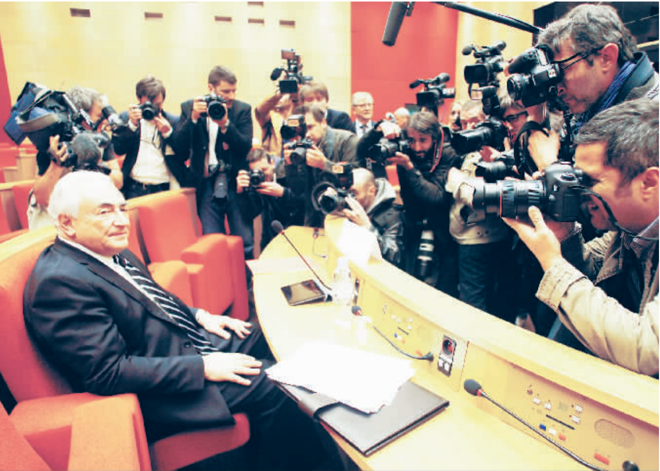
当地时间2日，法国里尔，国际货币基金组织(IMF)前总裁史特劳斯·卡恩“淫媒案”在里尔市开审。被控合谋组织性交易的他一旦罪名成立，最高刑罚为十年监禁及150万欧元罚款。图为卡恩早前就逃税问题接受质询时的资料图片。