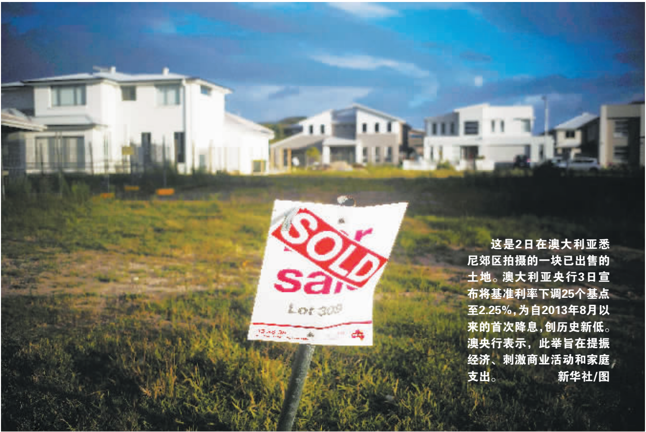
这是2日在澳大利亚悉尼郊区拍摄的一块已售出的土地。澳大利亚央行3日宣布将基准利率下调25个基点至2.25%,为自2013年8月以来的首次降息,创历史新低。澳央行表示,此举旨在提振经济、刺激商业活动和家庭支出。