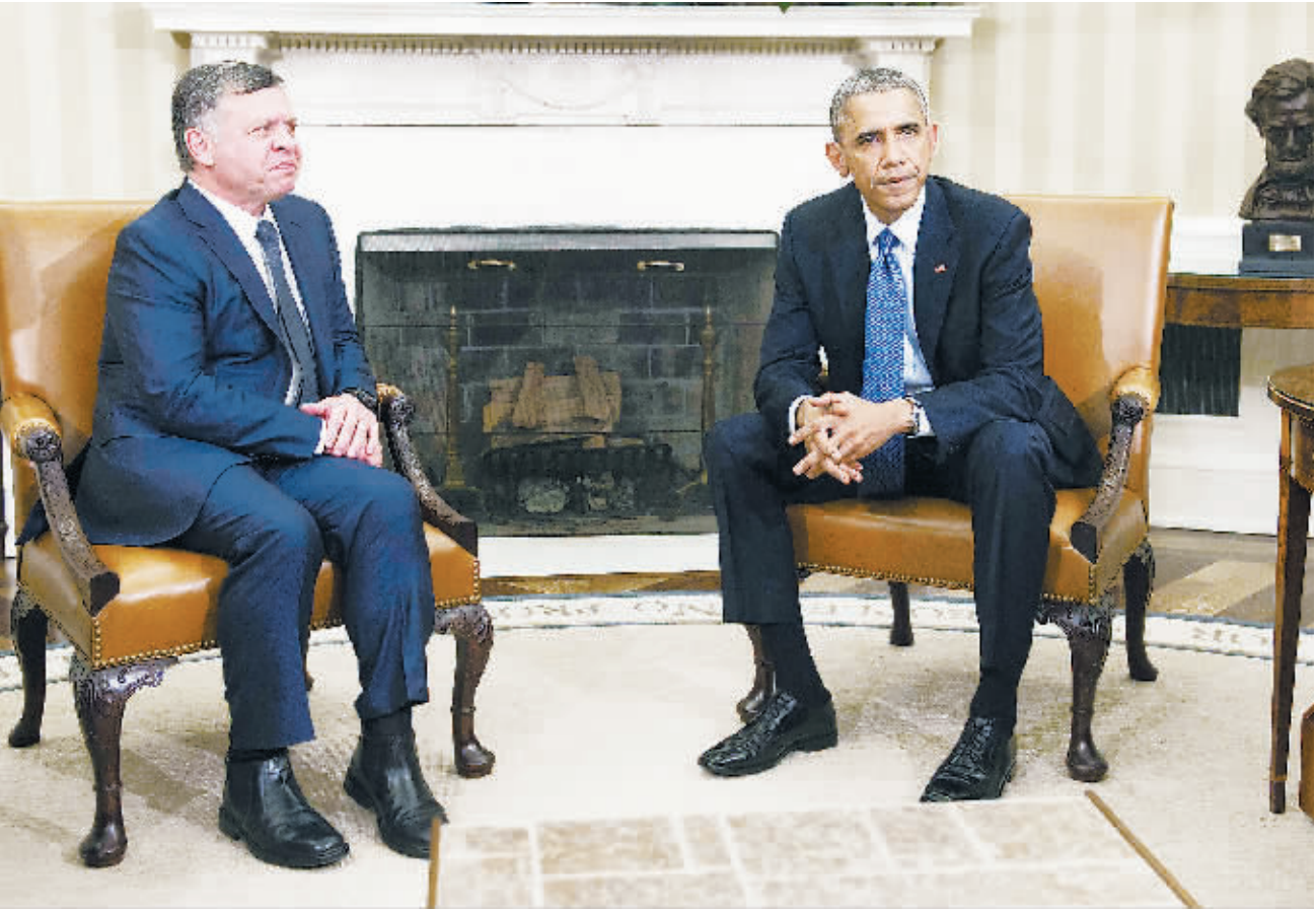
3日，美国华盛顿白宫，到访的约旦国王阿卜杜拉二世(左)和美国总统奥巴马举行会谈。约旦军方当日宣布，被极端组织“伊斯兰国”劫为人质的约旦飞行员卡萨斯贝已遭杀害，约旦军方将采取强有力的报复行动。正在美国访问的阿卜杜拉二世获悉卡萨斯贝遇害后，决定中断对美国的访问回国。

俄罗斯政府虽饱受油价暴跌带来的经济痛苦，但仍坚持维持既定产出以保住市场份额。在欧佩克会议召开之前，俄罗斯能源部长曾宣称将可能降低原油产量以提高低迷的价格，试图影响对欧佩克的决定。但财政收入窘困的俄方并不敢冒降低石油收入的风险实施减产行动。