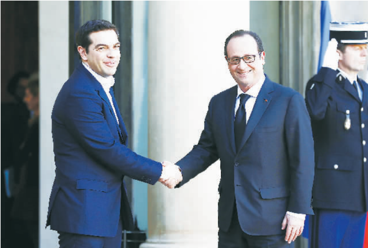
4日，在法国巴黎，法国总统奥朗德(右)迎接希腊总理普拉斯。奥朗德当日在巴黎爱丽舍宫会见了来访的希腊总理普拉斯。奥朗德表示，一方面要尊重希腊人民在选举中做出的抉择，另一方面也要遵守欧盟财政的有关规则以及包括债务问题在内的承诺。