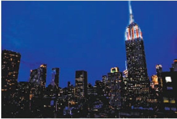
帝国大厦灯光装置效果图