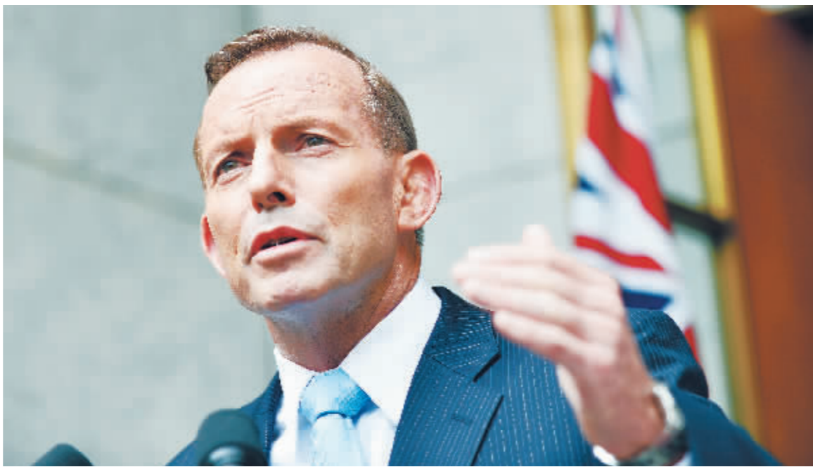
9日,在澳大利亚首都堪培拉议会大厦,澳大利亚总理托尼·阿博特在新闻发布会上讲话。当日上午,澳大利亚执政的主要政党自由党举行党内投票,现任党首、联邦总理阿博特赢得大多数自由党议员支持,保住总理一职。