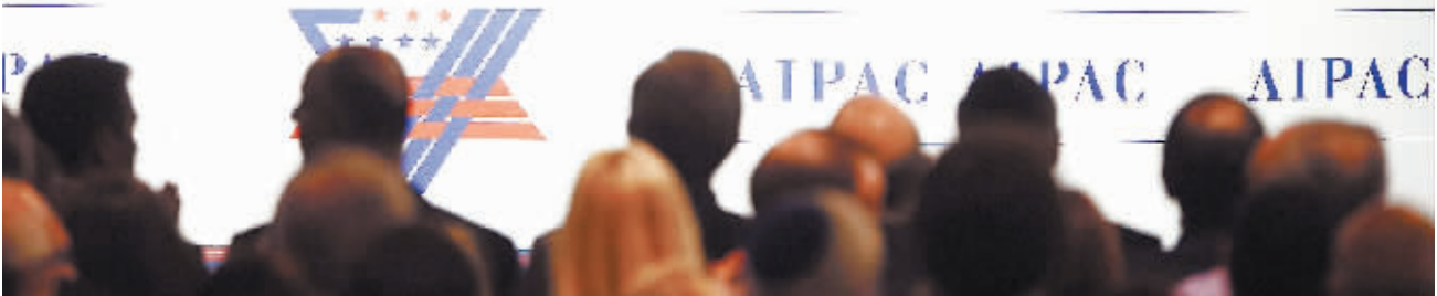
2日,在美国华盛顿,以色列总理内塔尼亚胡在美以公共事务委员会年度政策大会上讲话。内塔尼亚胡当日表示,尽管以色列和美国在伊朗核问题上存在分歧,但两国同盟关系“比以往更加牢固”。