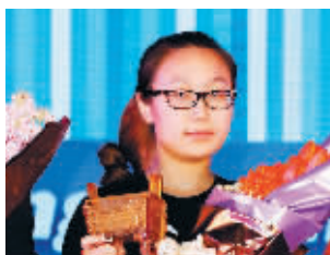
华润五彩城 企业代表

颁奖词: 24小时商业、白领生活新片场、HIGH爆京城的创意营销,是它去年最显著的标签。成为朝外时尚地标,它只用了一年。