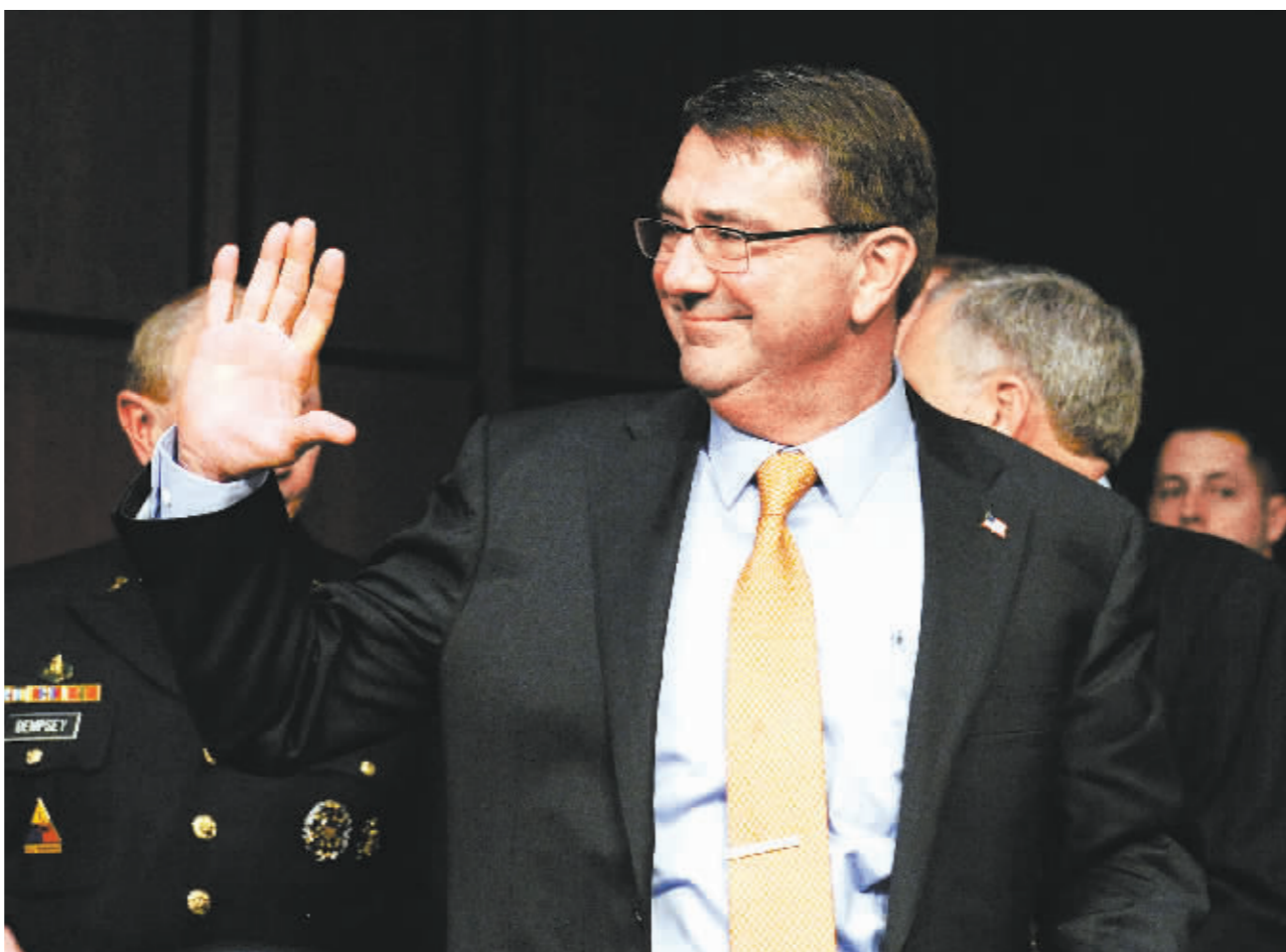
3日,在美国首都华盛顿,美国国防部长卡特步入听证会会场。卡特当日说,2016年国防预算削减将对美国国家安全造成威胁。日前,奥巴马政府为2016财年申请5850亿美元军费预算,涨至历史新高。