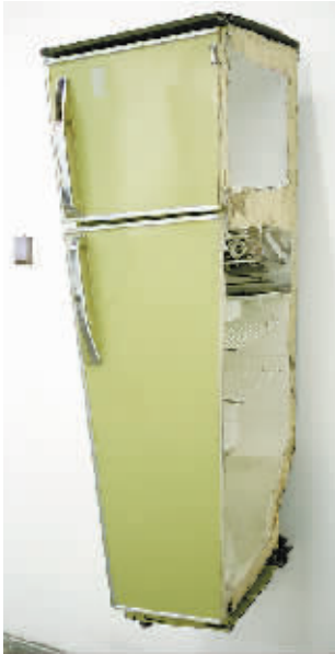
刘韡作品《看见的就是我的》 装置 2006年