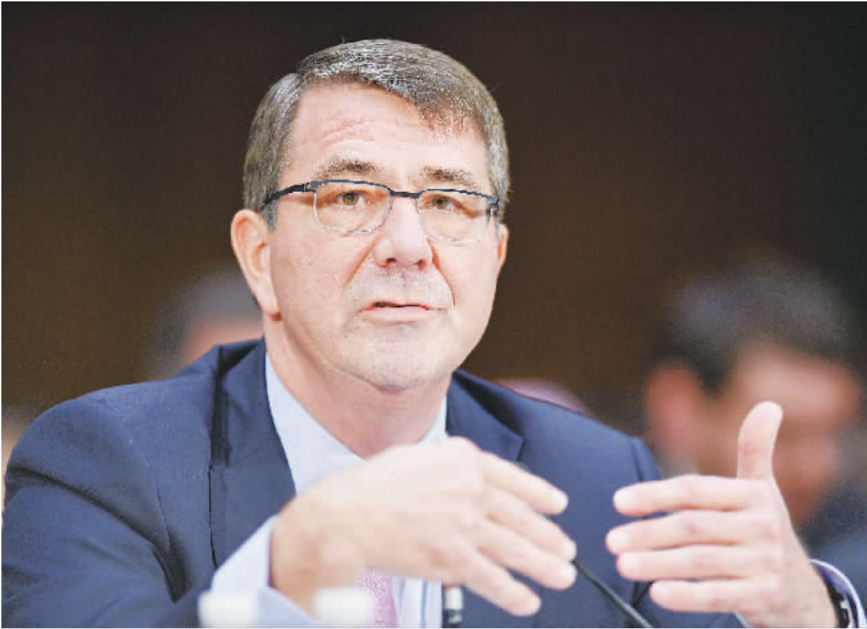
11日,在美国首都华盛顿,美国国防部长阿什顿·卡特在参议院外交关系委员会关于奥巴马寻求正式军事授权打击“伊斯兰国”的听证会上讲话。他说,打击极端组织“伊斯兰国”所要花费的时间可能要超过美国总统奥巴马此前向国会提交的军事授权议案中规定的三年期限。

一步降息25基点。 Zero hedge 11日刊文分析称,货币战争正在愈演愈烈。韩国央行出乎意料地将利率从2%下调至1.75%(彭博针对17名经济学家的调查显示,仅有2人预测到了这一点),以回击其最大的出口目的地——日本扩大量规模的动作。后者通过采取加码宽松、打压日元汇率而迫使韩元升值,导致韩国出口日本的产品在价格上的竞