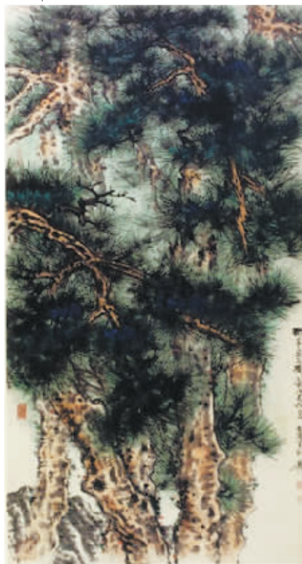
该作为谢稚柳《五松图》赝品,上款中的“研吾”系2010年纪念谢稚柳诞辰百年拍卖中某件谢稚柳书画的挖款。