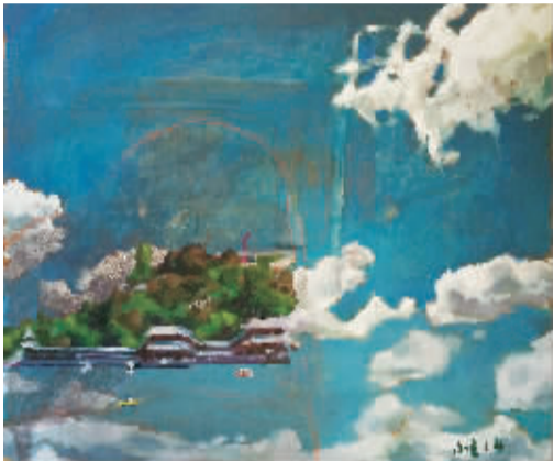
《蓝天白云》70cm×80cm 布面油画 2014年