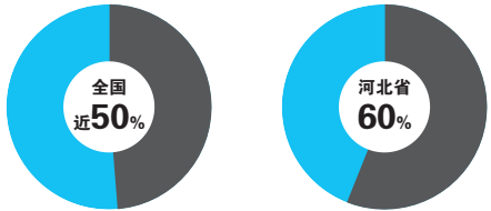
2015年1-10月钢铁业亏损情况一览