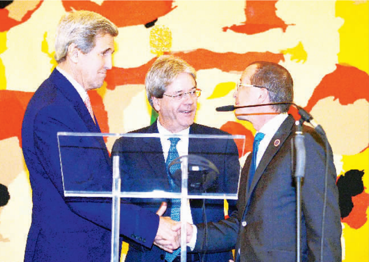
13日,在意大利罗马,美国国务卿克里、意大利外长真蒂洛尼和联合国利比亚问题特别代表科布勒(从左至右)在新闻发布会上握手。利比亚问题国际会议当日在罗马举行,与会国家和国际组织代表会后发表联合声明,支持利比亚建立民族团结政府。