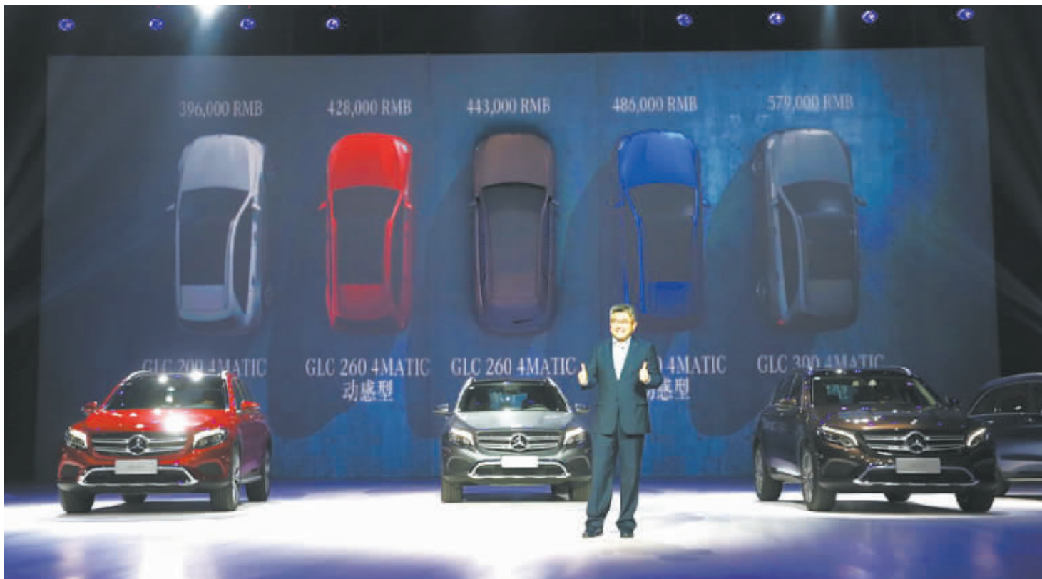
2015年11月19日,全新GLC SUV于广州车展前夜正式上市

2015年11月19日,广州车展前夜,广州体育馆人气爆棚,星徽璀璨。作为梅赛德斯-奔驰SUV年的一款重磅收官力作——全新GLC SUV耀世登场。全新GLC SUV的正式上市不但为梅赛德斯-奔驰的星徽光芒闪耀广州车展再添重要筹码,也为梅赛德斯-奔驰SUV年画上了一个完美句号。众所周知,每届广州车展都是各企业在年底之前的最后一次重要展示舞台,也是各品牌总结全年成果并展望来年的盛会。回望2015年,梅赛德斯-奔驰以平均每个季度推出一款的超高频率为中国市场及消费者带来了四款全新SUV车型,其厚积薄发之姿态,必将在国内SUV市场的发展中留下一段广为流传的佳话。