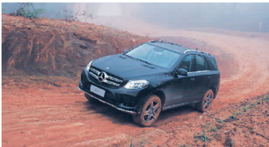
新一代梅赛德斯-奔驰GLE SUV

梅赛德斯-奔驰在这一年为中国的消费者相继带来4款重量级SUV,以平均每季度一款全新SUV的惊人投放频率与力度创下了豪华SUV的新车投放纪录。这4款SUV车型从紧凑型到中型豪华SUV,再到全尺寸豪华SUV,从运动风格强烈的运动SUV到越野性能突出的经典豪华SUV,完成了梅赛德斯-奔驰对SUV全局市场的无缝隙覆盖,也为不同细分市场的消费者提供了更多样的选择。除此之外,梅赛德斯-AMG GLE 63 4MATIC、GLE 63 S 4MATIC、GLE 63 4MATIC运动SUV,以及在广州车展上首次亮相的梅赛德斯-AMG G 63 Edition 463等多款来自AMG家族的SUV车型也在这一年倾情奉上,令梅赛德斯-奔驰“SUV年”实至名归。