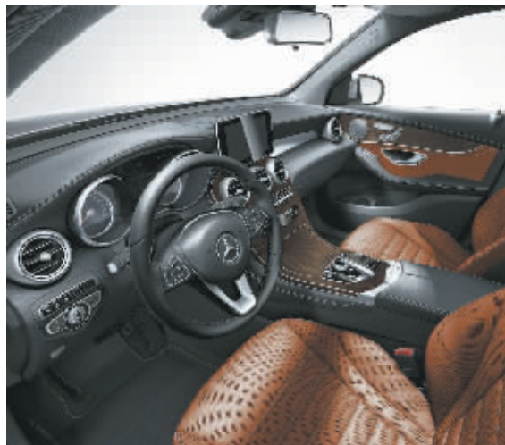
全新GLC SUV精美内饰从广受好评的C级车汲取设计灵感

全新GLC SUV搭载了拥有梅赛德斯-奔驰第三代直喷技术的2.0升涡轮增压发动机,动力充沛且拥有极佳的燃油表现;全系标配9速自动变速箱(9G-TRONIC)、五种驾驶模式的动态操控选择器(DYNAMIC SELECT)、带可调减震系统的敏捷操控悬挂系统等先进配置相辅相成,带来敏捷灵活的操控感;而越野技术组件搭配梅赛德斯-奔驰引以为傲的全时四轮驱动(4MATIC)令其越野能力能够适应多种极端复杂路况。此外,包括限距控制系统增强版(DISTRONIC PLUS)等在内的一系列先进全面的主、被动安全系统,很多也是首次装备在GLC这