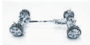
可调减震的敏捷操控悬挂系统带来敏捷灵活的操控感

驰在中国推出的首款采用9速自动变速箱车型,GLE运动SUV带来运动且舒适的驾控体验和超凡的燃油经济性。