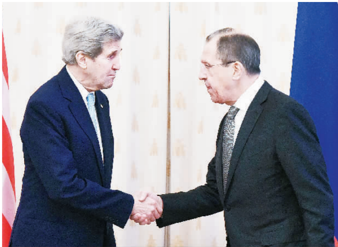
15日,在俄罗斯首都莫斯科,俄罗斯外长拉夫罗夫(右)与来访的美国国务卿克里握手。克里15日抵达俄罗斯首都莫斯科,与俄外长拉夫罗夫举行会谈,寻求在解决叙利亚危机和乌克兰问题上进行合作。这是克里今年第二次访俄。