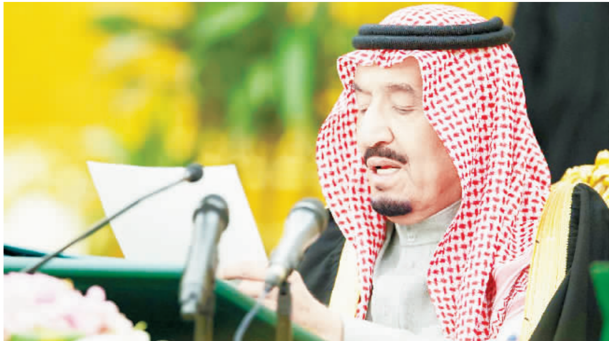
当地时间28日,沙特国王萨勒曼在沙特利雅得主持内阁会议。

周一,沙特国王批准沙特阿拉伯2016年财政预算案,2016年收入预期为1368亿美元,开支预期为2239亿美元,赤字高达870亿美元。沙特阿拉伯宣布将在2016年预算案中削减支出,对改革和私有化进行补贴,以遏制长期低油价导致的日渐增大的赤字。此外,沙特政府从29日起削减能源补贴,汽油价格将提升40%以上。并且,除了汽油之外,由国王萨勒曼率领的内阁也宣布将调涨电力、水、柴油和煤油的价格。