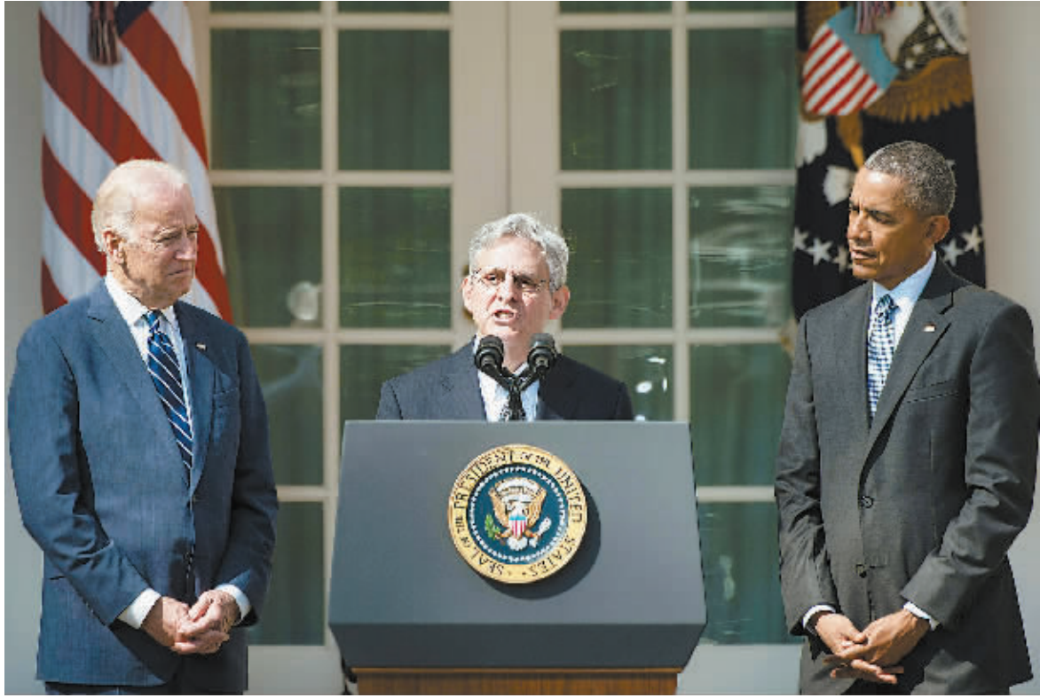
3月16日,在美国华盛顿白宫,哥伦比亚特区上诉法院大法官梅里克·加兰(中)发表讲话,美国总统奥巴马(右)与副总统拜登在一旁聆听。 奥巴马16日正式提名梅里克·加兰担任美国最高法院大法官,填补保守派大法官安东宁·斯卡利亚上月去世后留下的空缺。然而,参议院多数党领袖、共和党人麦康奈尔当天明确表示,参议院将不会就加兰的任命举行听证会和投票。麦康奈尔坚持要求由下一任美国总统而非奥巴马对大法官进行提名,这是为了维持保守派在最高法院中的相对优势地位。

对近期经济形势的评价中同样可以看到美联储在传统指标外的隐忧。美联储表示,美国经济活动以温和速度扩张,家庭支出增加,但企业投资和净出口疲软。 “加息不可避免地带来美元升值,从而影响美国的出口。虽然美国是一个以自身消费作为GDP主要支撑的国家,但出口在GDP占比超过10%仍然是不容忽视的一部分。美国经济2%的增长情况只能算做中低速增长,加息如何确保经济不衰退其实是两难的抉择。”中国社科院美国研究所研究员陈宝森在接受北京商报记者采访时进一步分析指出。 在3月更新的各项经济数据预测中可以看出,整体看官员们对GDP预测悲观,他们预计2016年GDP增速为2.2%,比去年12月时低了0.2个百分点。海外经济疲软、美国出口受到影响,可能是官员们下调GDP增速的原因。