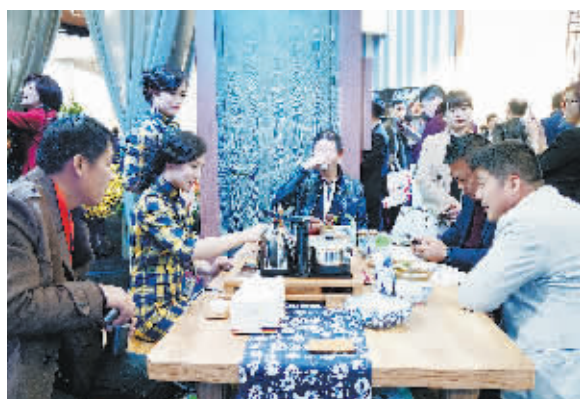
门展会上的霍尔茨木门展厅里,茶香飘荡,人们品茗交流,感受到别有情趣的生态空间之美。