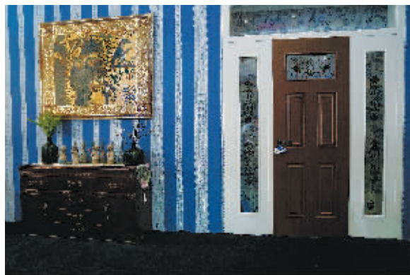
霍尔茨倡导的生态空间理念,将木门与配饰进行有机搭配,形成和谐的整体。