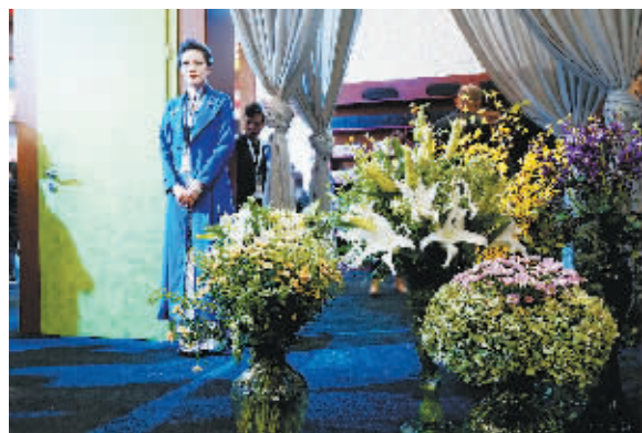
将木门赋予自然色彩,将百合等新鲜花卉置于居室内,生态空间便如同大自然一样清新醉人。