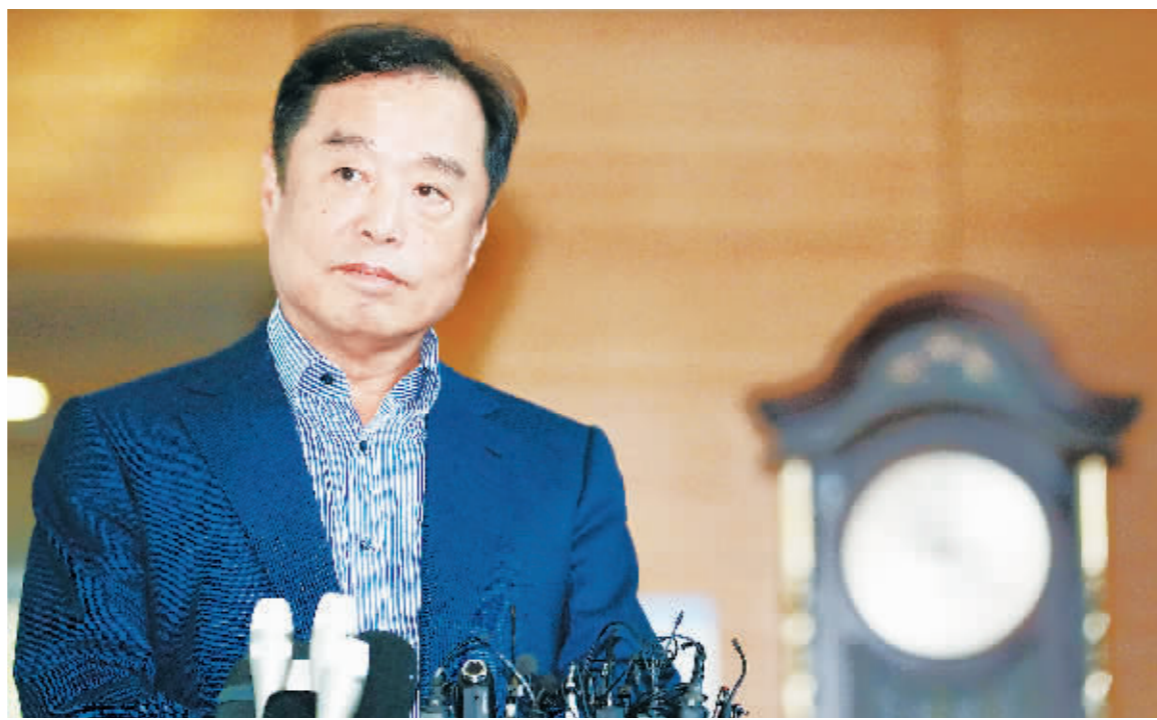
2日,新总理人选金秉准在韩国首尔接受记者采访。

继10月30日仓促改组总统府后,韩国总统朴槿惠2日提名卢武铉总统时期幕僚金秉准为新总理人选。