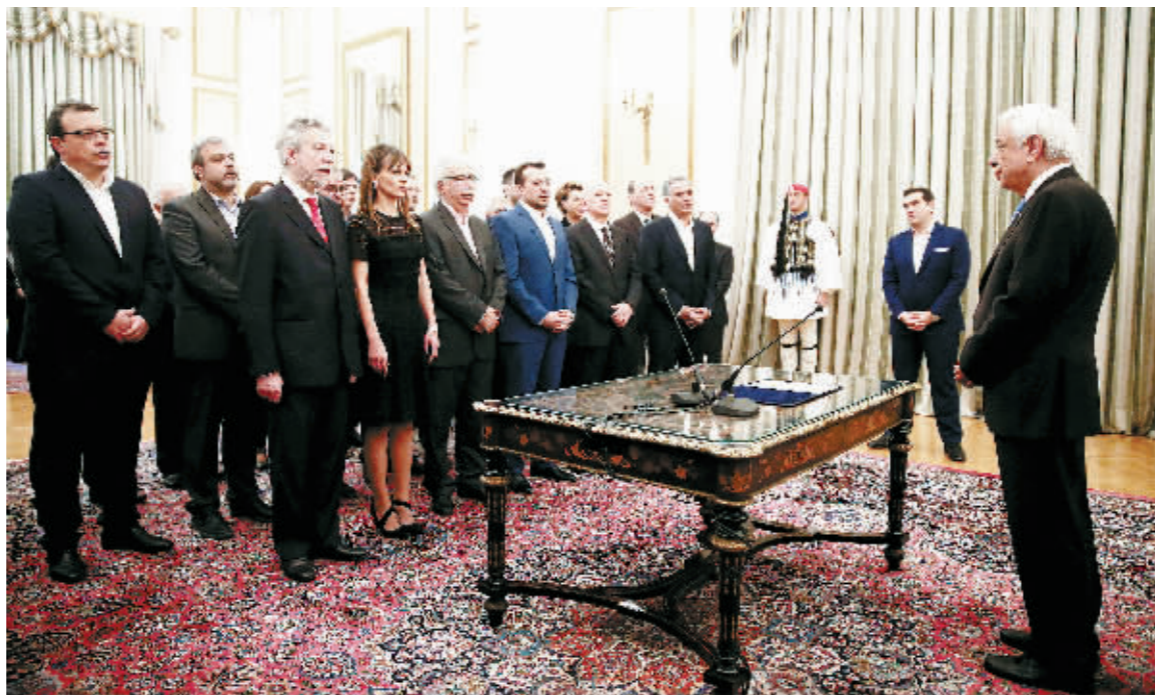
5日，在希腊首都雅典总统府，希腊总理齐普拉斯(右二)及希腊总统帕夫洛普洛斯(右一)出席新内阁宣誓就职仪式。

希腊总理齐普拉斯及多名内阁成员5日表示，新内阁将把工作重点放在恢复经济增长及改善人民生活方面。