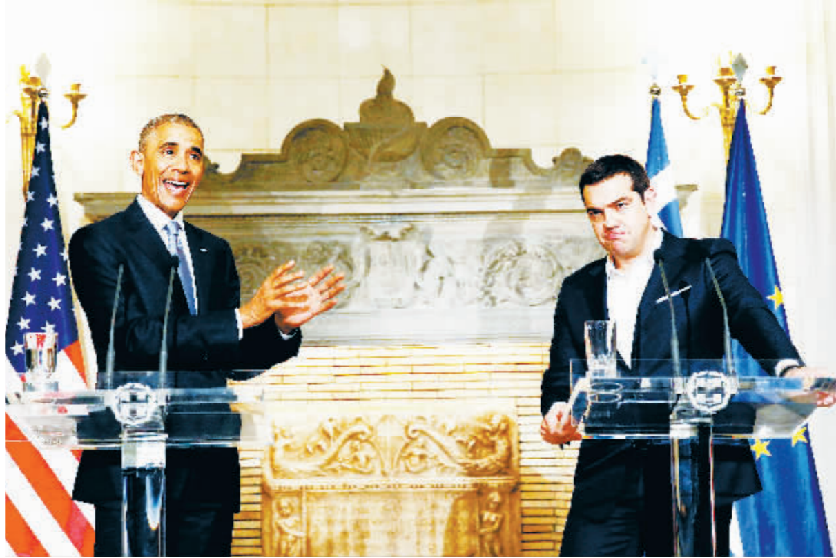
15日,在希腊首都雅典,美国总统奥巴马(左)与希腊总理齐普拉斯出席新闻发布会。

美国总统奥巴马15日在访问希腊时说,美国坚定支持希腊克服债务危机的努力,并表示在希腊进行改革的同时应该结束紧缩措施并减免其债务。