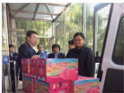
税务干部积极认购吉县苹果

2016年,山西吉县全县苹果受灾面积79697亩,其中,平安苹果园面积近4万亩,北京市朝阳区国税局、地税局了解到这一情况后,党员个人带头认购当地苹果,带动全体税务干部积极参与认购,对吉县果农开展精准扶贫。