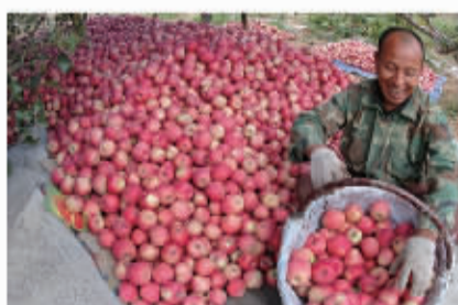
一解燃眉之急,吉县果农满面笑容地准备苹果装箱

税务部门党员同志带头认购当地苹果,并发动身边群众多多进行情况宣传、积极认购苹果,并积极开展苹果销售,目前共购买苹果4300多箱,一共86000余斤,总价值17万余元,第三次认购也在积极进行中。在此,也希望社会大众能够伸出援助之手,更大地缓解灾情引发的苹果滞销,帮助广大吉县果农走出困境。