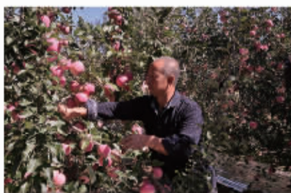
有了扶贫行动,果农幸福的采摘苹果

精准扶贫工作搞的好不好,干部也是关键之一。“两学一做”,做,就是要做合格党员。党员干部的帮扶对象能不能脱贫,也是检验党员是否合格的重要标准。党员干部要切实将“两学一做”与精准扶贫结合起来,为建设中国特色社会主义而奋斗。