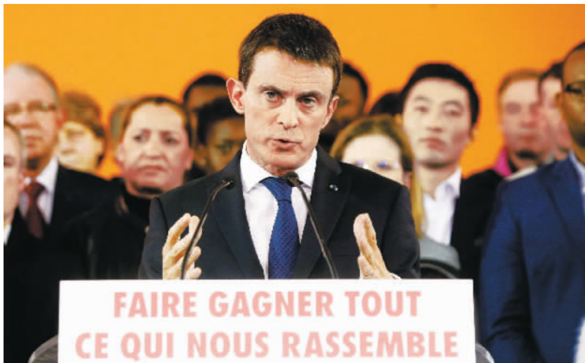
法国总理瓦尔斯5日在巴黎南郊正式宣布将参加法国总统竞选，并表示自己将于6日辞去总理一职。