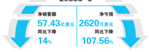
2016年三季度爱立信业绩一览