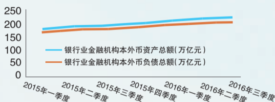
2015年以来银行业金融机构本外币资产及负债总额

虽然近几年银行业资产负债表快速扩张,但无论从资产端还是从负债端来看,存贷款在资产负债表中的占比均明显下降。有数据显示,贷款占总资产的比重由2003年的约61.4%,降为现在的49.5%;存款占总负债的比重由2003年的82.7%,降为现在的68.9%。银行的投资类资产大幅度增加。货币投放主要跑到信贷之外的投资类资产,这些资金中的相当一部分流入到各级政府手中,主要用于基础设施投资,并成为近两年来拉动中国经济增长的重要力量。