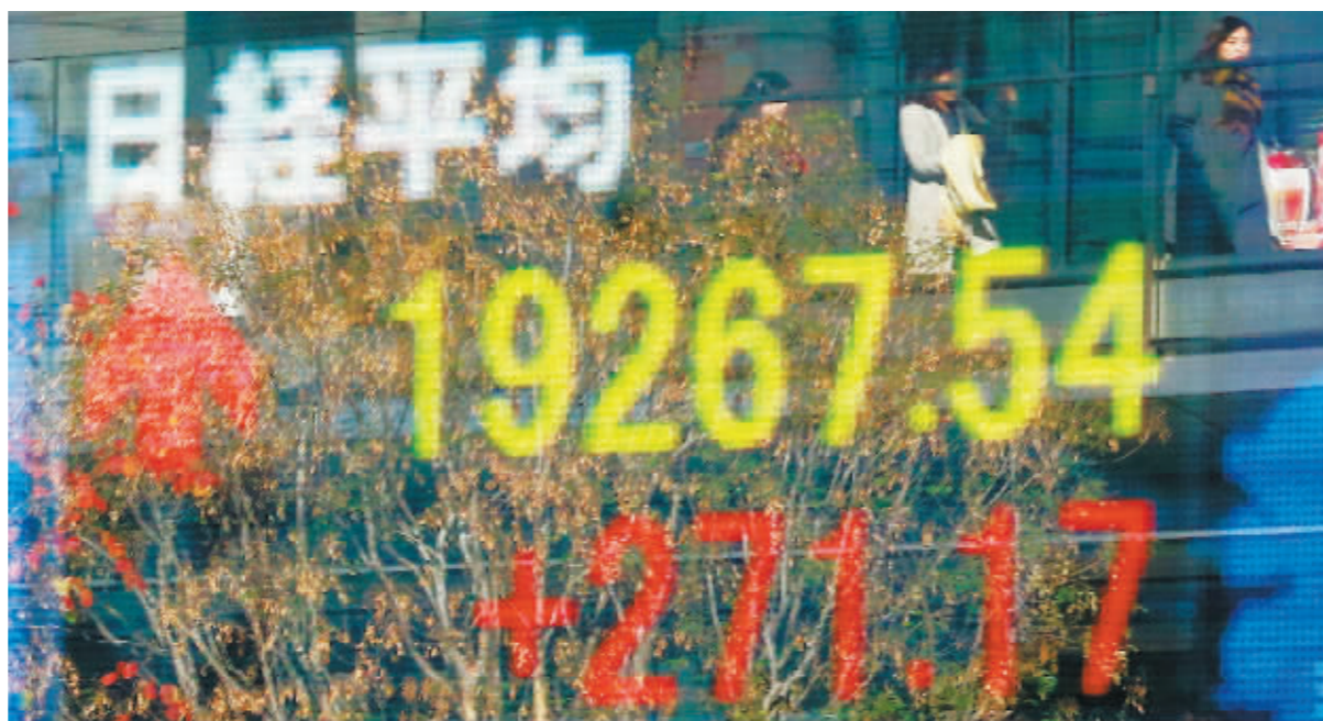
12日，在日本东京街头，行人的影子映射在一处股价显示屏中。

受上周五美国股市全面上涨及日元贬值刺激，东京股市12日高开高走，日经225种股票平均价格指数突破19000点关口，再创年内新高。