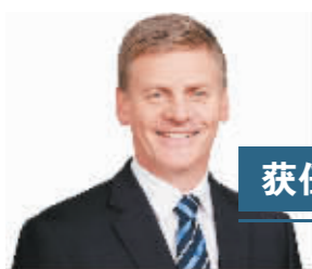
比尔·英吉利希 获任新西兰政府总理

新西兰总督帕齐·雷迪12日在总督府任命执政党国家党新任党首比尔·英吉利希为政府总理，接任辞职的约翰·基。雷迪同时任命国家党副党首保拉·贝内特为副总理。