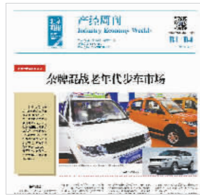
本报针对老年代步车傍大牌、杂牌混战等乱象连续报道引发广泛关注。

的商家则扩充了电动车维修店的经营范围,增加了老年代步车销售业务。这些店面的经营方式多为个体经营,并且不能开具发票。