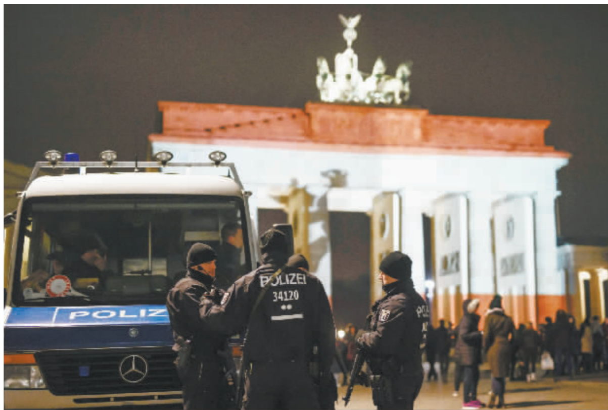
20日,在德国柏林,警察在勃兰登堡门前执勤。

德国首都柏林19日发生货车冲入圣诞集市的恐怖袭击事件,造成至少12人死亡,49人受伤。同一天,瑞士苏黎世市中心一座清真寺发生枪击事件,造成至少3人受伤。两起袭击发生后,欧洲多国表示将采取措施,确保节日期间的公共安全。