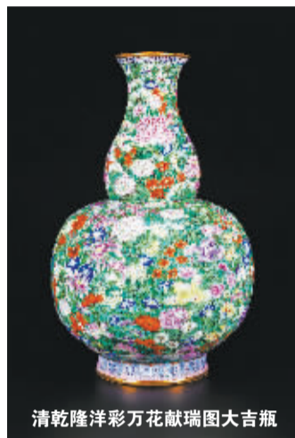
清乾隆洋彩万花献瑞图大吉瓶

文化,在商业领域向来是遭受冷遇的角色。漫长的市场培育过程,让很多急于实现商业诉求的企业望而却步。轻资产的拍卖行业也是如此,成本、精力、时间都是极大的消耗,短期内可能还难以收到实质性的回报。