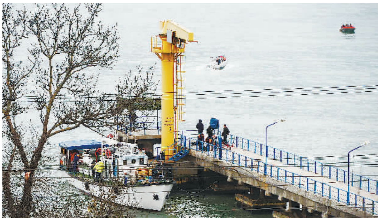
25日,在俄罗斯索契黑海水域,搜救团队在海上搜索俄军图-154飞机。

俄罗斯国防部25日确认,一架载有92人的图-154飞机莫斯科时间当天清晨在黑海失事,目前已经在水下发现飞机碎片。