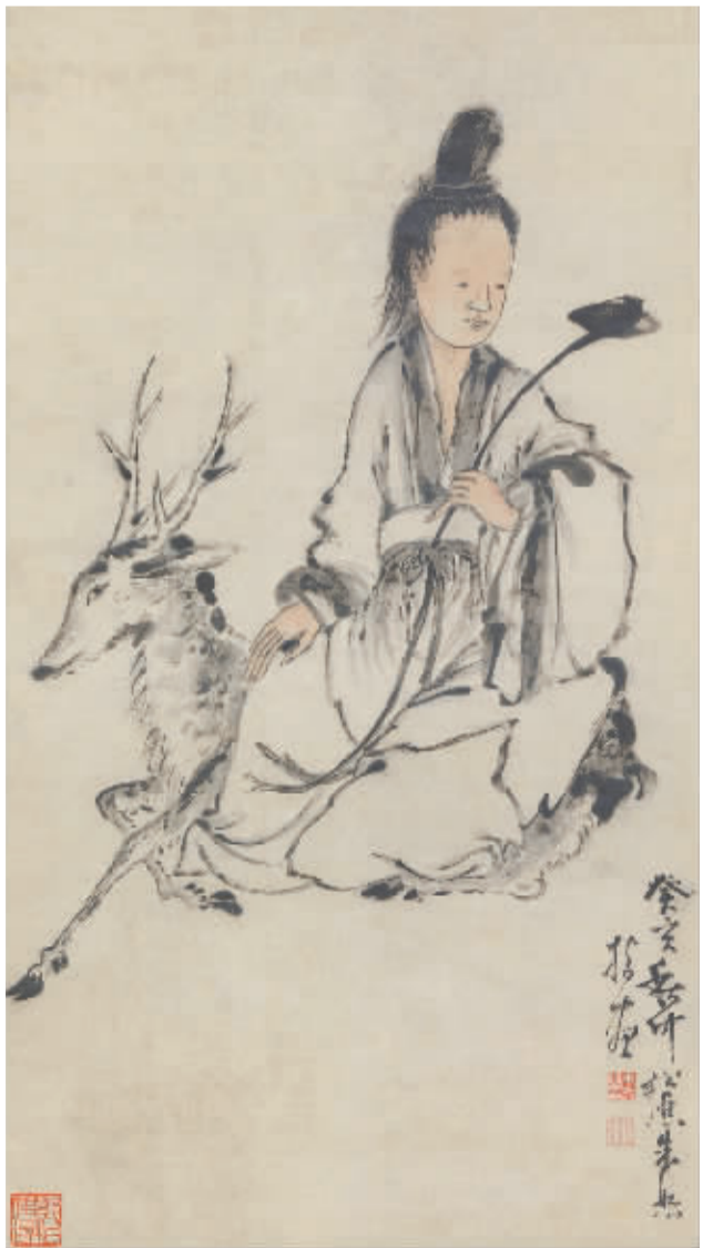
2016年，北京匡时春季拍卖会上，明代朱恕的《指画麻姑》以115万元成交，成为今年指画拍卖场上拍出的最高价格。