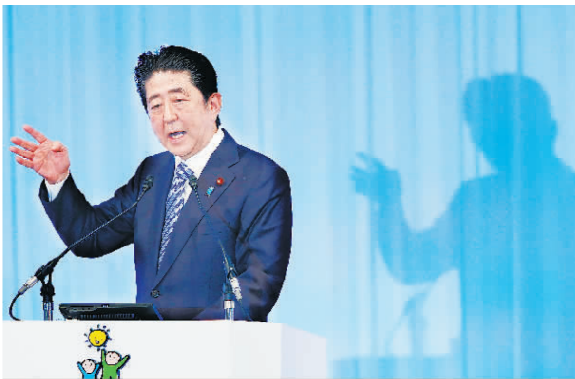
3月5日，自民党现任总裁、日本首相安倍晋三在日本东京举行的第84次自民党大会上发言。