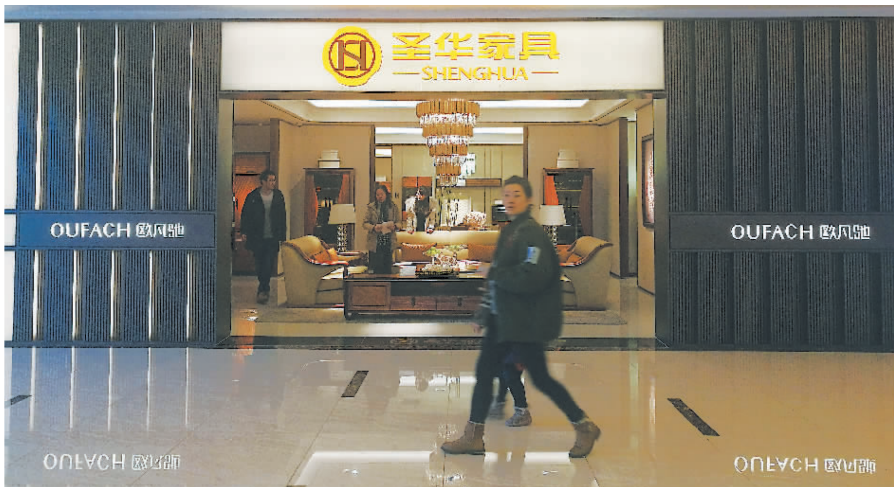
运用鬼斧神工的木作技艺,圣华欧凡驰将天马行空的想象凝固为实木家具。