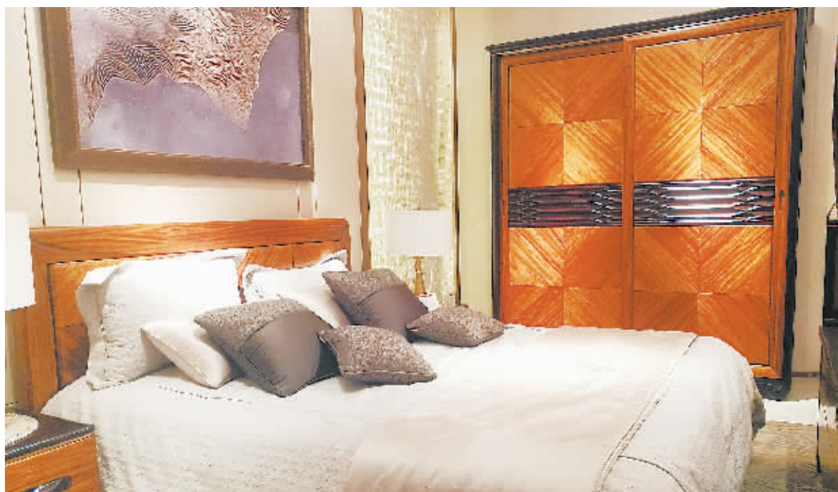
这些浑然天成的木纹,是由5公分宽的木料拼凑而成。