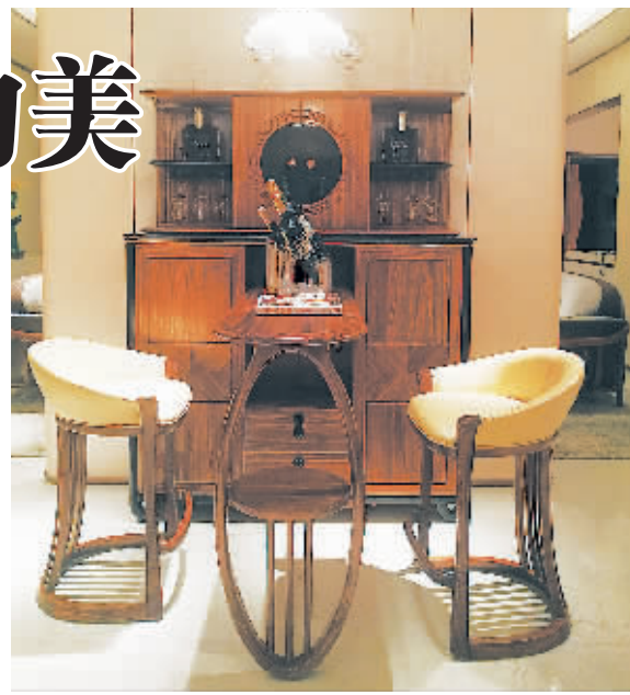
不只是线条边缘,欧凡驰选用的天然材质也透露着线条之美。