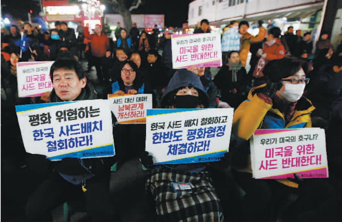
3月8日，在韩国庆尚北道星州郡金泉市，民众参加抗议活动。

“萨德”系统部署地韩国庆尚北道星州郡和金泉市民众8日相继在当地举行抗议示威活动，强烈反对“萨德”系统入韩。