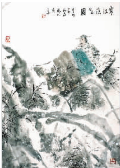
纪清远《寒江渔隐图》49cm×69.2cm