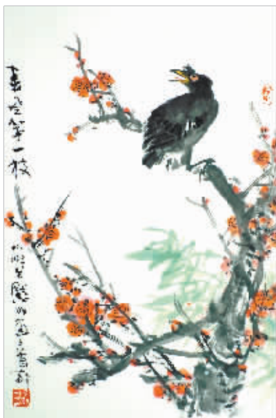
金默如《春风第一枝》45cm×68.7cm