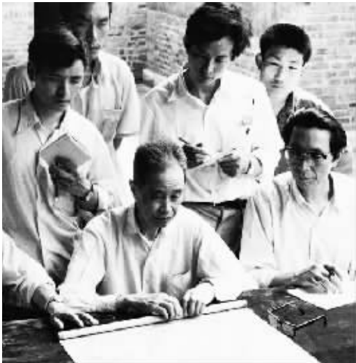
鉴定书画中的徐邦达(前排右二)

年轻的徐邦达家境殷实,交友广泛。百乐门他是金主,博物馆他是常客。20两重金并没有让他望而却步,反而越挫越勇,23岁为乾隆判了“死刑”的《富春山居图》翻案,26岁应叶恭绰之邀为上海博物馆筹办文献展,新中国成立后被郑振铎调到北京供职于文物局、故宫。从此足迹遍布大江南北,80余年为国家鉴定、考证、收购、征集传世名迹近4万件,终成一言九鼎的国家级鉴定大师。付梓出版《古书画鉴定概论》、《古书画伪讹考辨》、《古书画过眼要录》、《重编清宫旧藏书画目》等。其中起笔于上世纪40年代末,经数十年边撰写、边修改、边出版的《古书画过眼要录》累计170余万字。有个词叫著作等身,对于个子不高的徐邦达来说,他的著作摞起来比姚明还高。