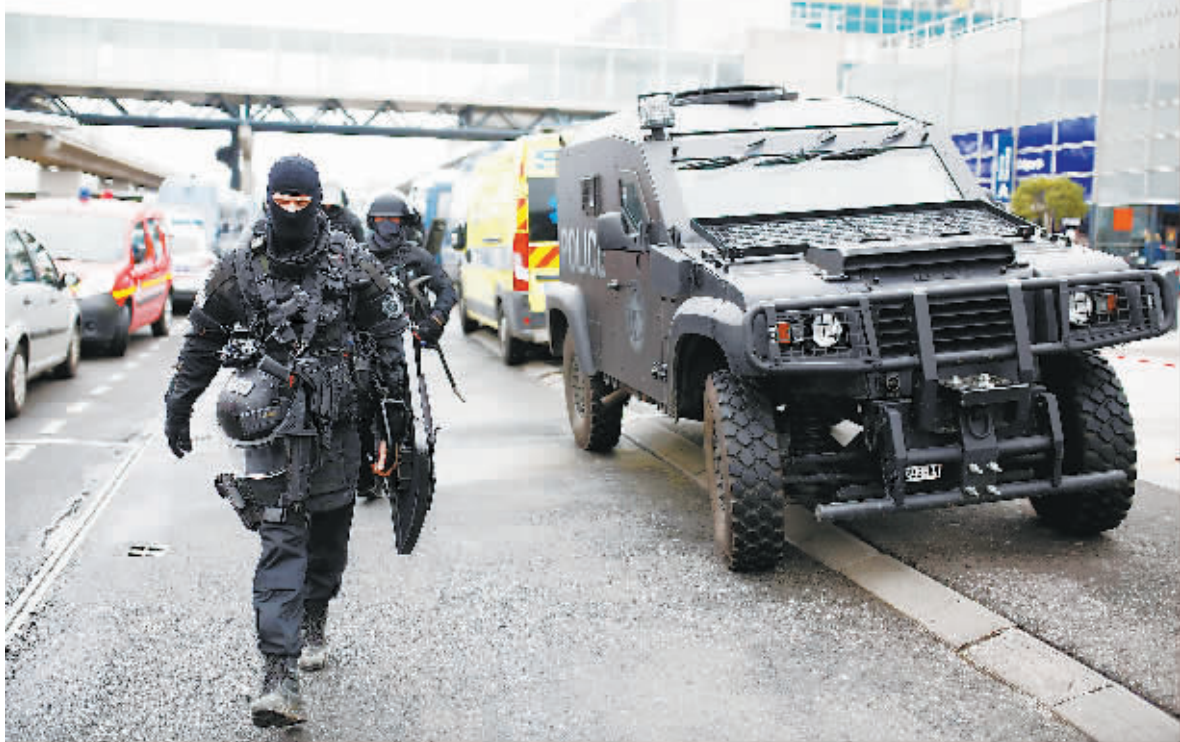
18日,法国特警部队抵达巴黎奥利机场。

过去一年发生的系列恐袭事件令法国以及巴黎进入二战后“最不安全”的时期。近日,法国又接连发生三起恐怖袭击事件。