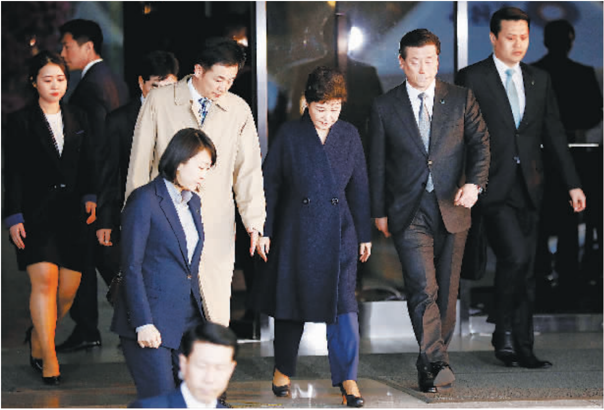
3月22日,韩国前总统朴槿惠(右三)走出韩国首尔中央地方检察厅。