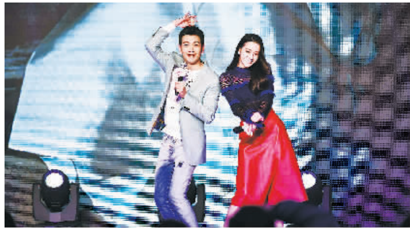
1月9日,上海,电视剧《三生三世十里桃花》举行发布会

据悉,国泰航空发言人表示,涉事A330客机于起飞前发现燃油渗漏情况,为了让机上135名乘客尽快启程,遂安排另一架客机于上午11时30分出发,飞往上海浦东机场,并于等候期间为乘客提供餐券,公司现正调查事故原因,涉事客机事后已拖走进行维修及检查。香港机管局则表示,针对国泰CX368航班轻微燃油溢出情况,局方已按机制通知消防员到场并戒备,机场运作不受影响。