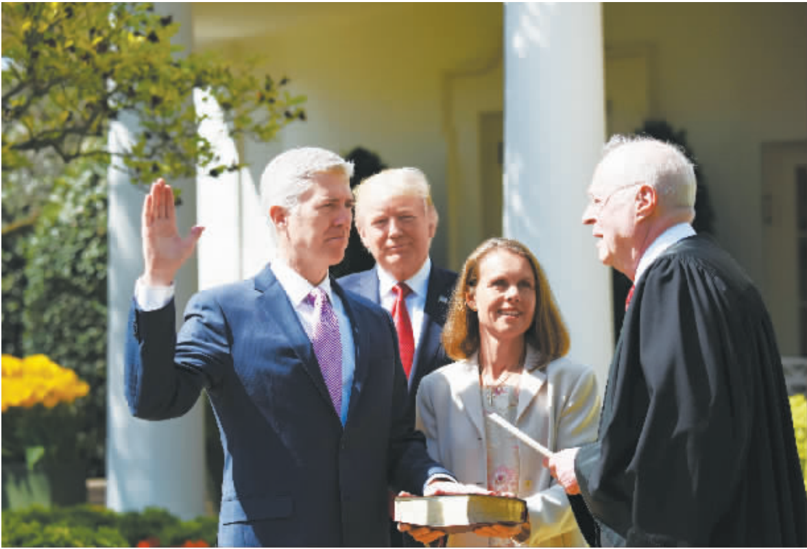
4月10日,戈萨奇(左一)在美国华盛顿白宫宣誓就任大法官。

美国联邦第十巡回上诉法院法官尼尔·戈萨奇10日在白宫正式宣誓就任最高法院大法官,他的就职使最高法院重新回到了保守派大法官占相对多数的局面。