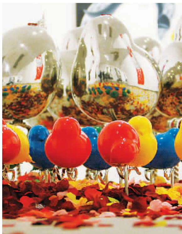
《不稳定因素》(局部) 雕塑