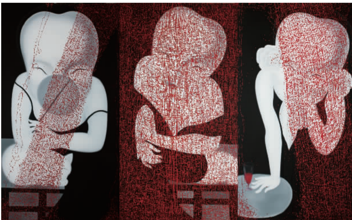
《困聊淡侃》布面油画